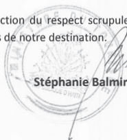
Stéphanie Balmir VILLEDROUIN Ministre

Le classement de l'établissement de 1 à 5 Hibiscus sera fonction du respect scrupuleux des critères présentés dans ce guide pour assurer, tous ensemble, le succès de notre destination.